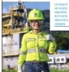
Las mujeres son protagonistas de la cara laboral de la empresa.

Argos coloca todas sus acciones de sostenibilidad en los Objetivos de Desarrollo Sostenible (ODS) de la ONU, específicamente en el ODS Trabajo Decente y Crecimiento Económico. Ha establecido un Comité de Género, conformado por hombres y mujeres por igual, de diferentes áreas de la compañía. Su finalidad es velar por la implementación de políticas de inclusión y diversidad que garanticen la igualdad de trato para todos.