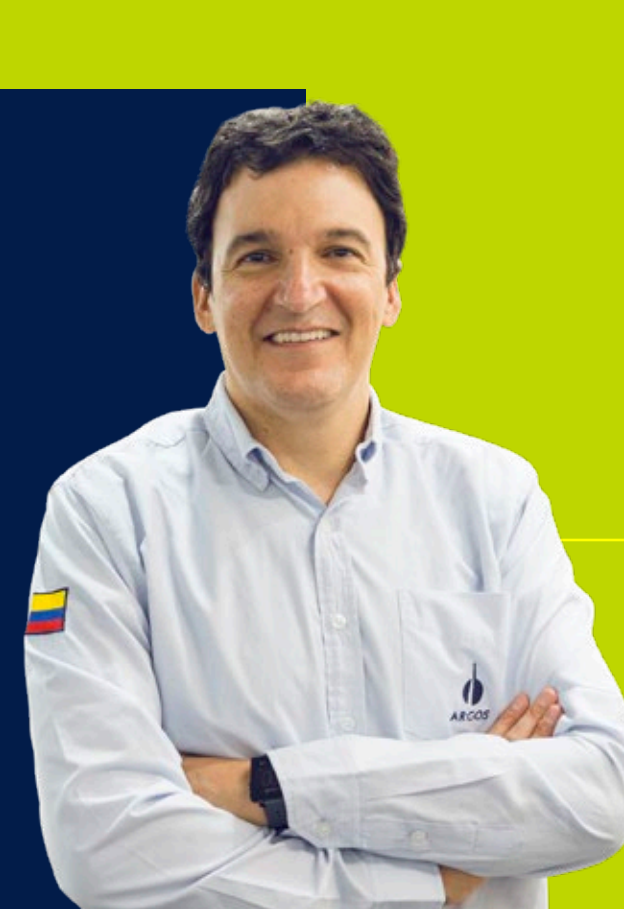
Juan Esteban Calle, presidente.

El tercer trimestre fue muy importante para seguir consolidando los avances del programa SPRINT y desarrollando el plan estratégico de Argos. Los resultados particularmente en Estados Unidos, Colombia, Panamá y República Dominicana fueron muy positivos y resaltan el buen posicionamiento de la compañía con nuestros clientes y el foco de todos los equipos en seguir evolucionando nuestras propuestas e impulsando el crecimiento rentable de los negocios, con el fin de generar valor para nuestros accionistas y todos los grupos de interés en los 16 países y territorios donde estamos operando.